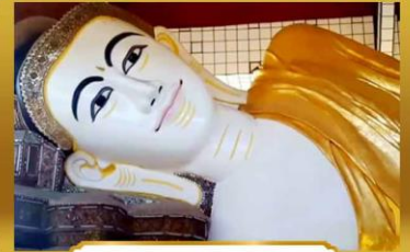
พระพุทธรไสยาสันเขเวตาเลียว