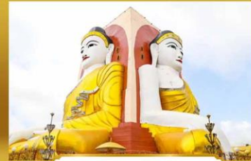
เจดีย์ไฉ่ปุ่น