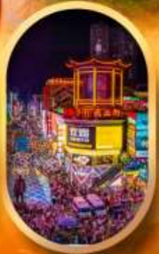
ถนนคนเดินซิงลู่