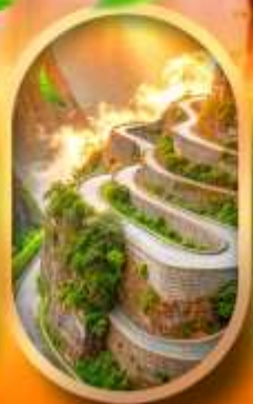
หุบเขาป่าย้งจาง