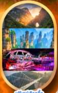
ฟรีเคย์เลือกซื้อ Option เสริม