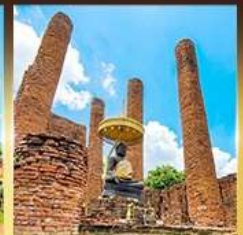
วัดรรมิตรราช