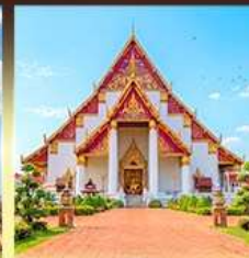
วิหารพระมงคลมิ่งมิตร