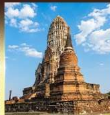
วัดราชบูรณะ