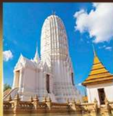
วัดพระศรีสรรเพชญ์