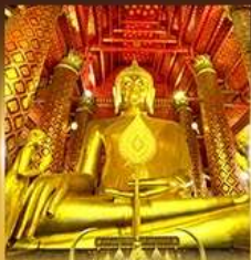
วัดนิมิตเชิงหวางวิหาร