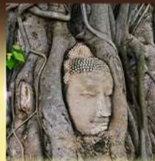
วัดมหาธาตุ