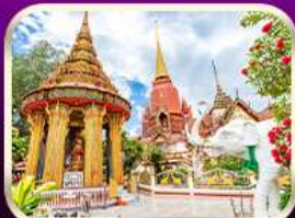
หอระฆังวัด วัดช้างให้