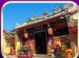
ศาลเจ้าแม่ลิ้มกอเหนี่ยว

ที่เที่ยวเพิ่มขึ้น และ ช่วยฟื้นฟูเศรษฐกิจขนาดใหญ่