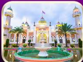
ชมมัสยิดกลางปัตตานี