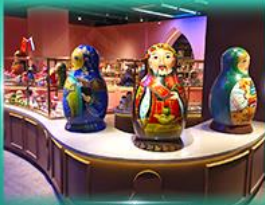
พิพิธภัณฑ์ ตุ๊กตาเป็ลูกดก