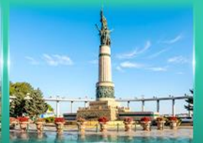
อนุสาวรีย์มังกร