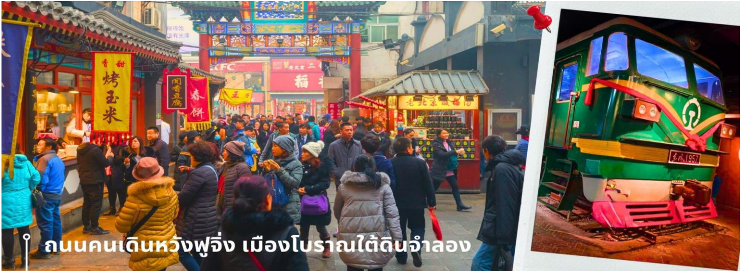
ถนนคนเดินหวังฝูจิ่ง เมืองโบราณใต้ดินจำลอง

นำท่านเดินทางไปยัง ถนนคนเดินหวังฝูจิ่ง เป็นสถานที่จัดกิจกรรมเชิงพาณิชย์ในกรุงปักกิ่งมานานหลายศตวรรษ ปัจจุบันเป็นที่นิยมอย่างมากในหมู่นักช้อปปิ้งและนักท่องเที่ยวที่แห่กันมาที่นี่เพื่อค้นหาสินค้าราคาถูกและเสื้อผ้าที่มีเอกลักษณ์เฉพาะตัว ถนนสายหลักเชิงพาณิชย์อันพลุกพล่านแห่งนี้มีร้าน บาร์ ร้านอาหาร และคาเฟ่ ซึ่งทุกแห่งมีจุดแวะพักผ่อน