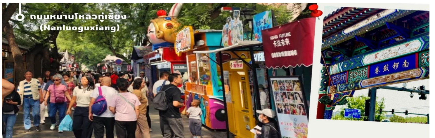
ถนนหนานโหลวกู่เซียง (Nanluoguxiang)

จากนั้นให้ท่านเพลิดเพลินไปกับ ถนนหนานโหลวกู่เซียง (Nanluoguxiang) หนึ่งในย่านฮิปและเก๋แก่ที่สุดใจกลาง เมืองปักกิ่ง ถนนคนเดินชื่อดังยาวประมาณ 787 เมตร กว้างราว 8 เมตร โดดเด่นด้วยสถาปัตยกรรมแบบ “ฮูทง (Hutong)” หรือ ซอยโบราณ ที่ผสมผสานกับร้านค้าสมัยใหม่ได้อย่างลงตัว ถนนสายนี้มีอายุกว่า 740 ปี ถือเป็นหนึ่งในย่านอนุรักษ์ทางประวัติศาสตร์ของปักกิ่ง และเคยเป็นย่านที่อยู่อาศัยของชนชั้นสูง ขุนนาง และเชื้อพระวงศ์ในยุคก่อน ตลอดสองข้างทางมีตรอกซอกซอยเล็กๆ แยกออกไปมากมาย แต่ละซอยยังคงกลิ่นอายชีวิตความเป็นอยู่แบบดั้งเดิม พร้อมร่องรอยทางประวัติศาสตร์ที่ยังคงหลงเหลือให้เห็นจนถึงปัจจุบัน ภายในถนนเต็มไปด้วยร้านค้า คาเฟ่ และร้านอาหารมากมาย ทั้งร้านเสื้อผ้า เครื่องประดับ ของที่ระลึก งานแฮนด์เมด และอาร์ตทอย เหมาะสำหรับเดินเล่น ช้อปปิ้ง และถ่ายรูป นอกจากนี้ยังเป็นแหล่งรวมสตรีทฟู้ดชื่อดังที่นักท่องเที่ยวไม่ควรพลาด