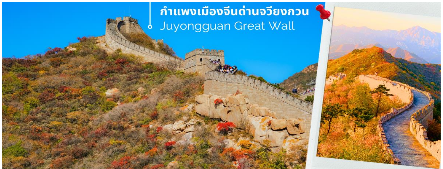
กำแพงเมืองจีนด่านจวิยงกวน Juyongguan Great Wall