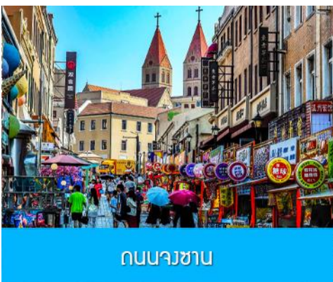
ถนนางซาน

นำท่านเดินทางชม สะพานจ้านเฉียว 栈桥 เป็นแลนด์มาร์คแห่งประวัติศาสตร์คู่เมืองชิงเต่า สร้างเมื่อปี ค.ศ.1891 มีลักษณะเป็นสะพานหินทอดยาวกว่า 440 เมตรสู่ทะเล ปลายสะพานมีศาลา ทรงแปดเหลี่ยมสีแดงที่โดดเด่น ซึ่งเป็นสัญลักษณ์บนฉลากเปียร์ชิงเต่า ขึ้นชื่อเรื่องวิวสวย รับลมทะเล ให้ท่านเก็บภาพบรรยากาศ