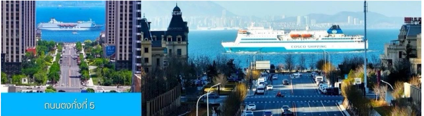
ถนนตงกั่งที่ 5

จากนั้นนำท่านเดินทางสู่ถนนหมายเลข 5 กังตงหัวเจีย ให้ท่านได้ชมถนนที่ทอดยาวลงทะเล ที่ 2 ข้างทางคือตึก ระฟ้า ทำให้ทัศนียภาพสวยแปลกตาเป็นอีก 1 ไฮไลท์ ที่ต้องมาเช็คอินของเมืองต้าเหลียน