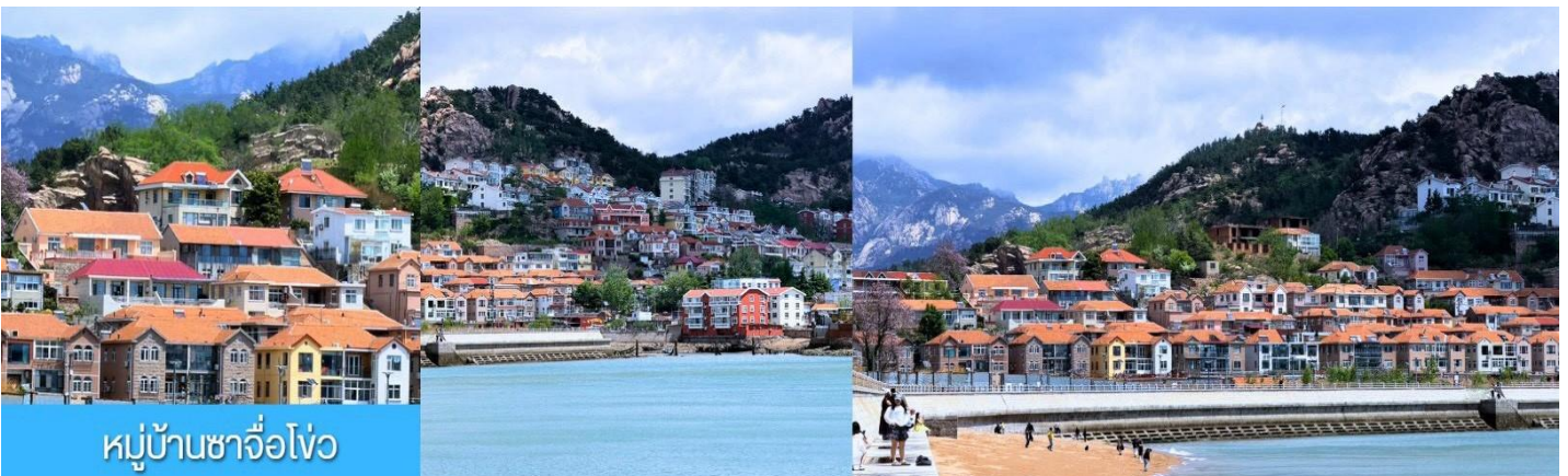
หมู่บ้านชาวโอ่ว