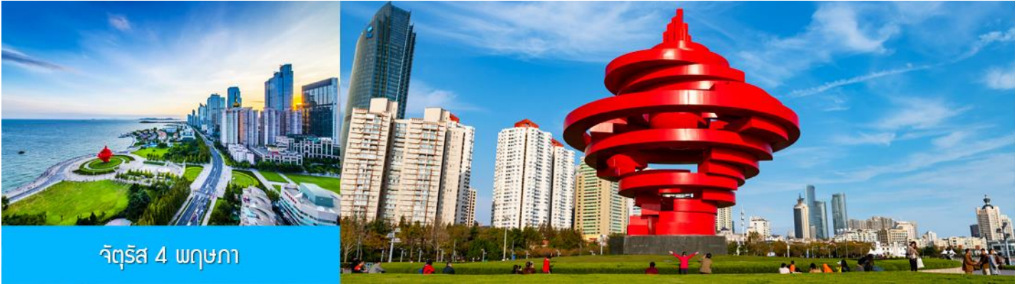
จัตุรัส 4 พฤษภาคม

จากนั้นนำท่านเดินเที่ยวชม จัตุรัส 4 พฤษภาคม May Fourth Square แลนด์มาร์กสำคัญริมอ่าวของเมืองชิงเต่า สถานที่แห่งนี้เป็นจุดที่ชาวเมืองออกมาเดินขบวนเรียกร้องอิสรภาพจากการปกครองของเยอรมัน เมื่อวันที่ 4 พฤษภาคม ค.ศ. 1919 หลังจากตกอยู่ภายใต้การปกครองมานานกว่า 10 ปี ปัจจุบันจัตุรัสแห่งนี้กลายเป็นพื้นที่พักผ่อนยอดนิยมของชาวเมืองและนักท่องเที่ยว และมีประติมากรรมสีแดงรูปเกลียว “May Wind” ที่สื่อถึงพลังและอุดมการณ์ของประชาชนในวันนั้นอย่างสง่างาม