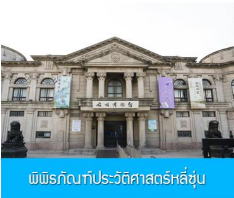
พิพิธภัณฑ์ประวัติศาสตร์ลี่ซุ่น

นำท่านเที่ยวชมและเก็บภาพ ณ สถานีรถไฟลี่ซุ่น 旅顺火车站 เป็นสถานีปลายทางของเส้นทางรถไฟสาขาเส้นหยาง - ต้าเหลียน สร้างขึ้นในปีค.ศ. 1903 ออกแบบโดยสถาปนิกชาวรัสเซีย เป็นอาคารอิฐก่อปูนผสมโครงสร้างไม้ตามสถาปัตยกรรมรัสเซีย.