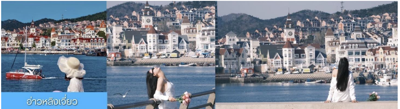
อ่าวหลังเจียว

หลังอาหารเช้านำท่าน เที่ยวชม ท่าเรือประมงหู่กาน 大连渔人码头 เป็นจุดเช็คอินที่โดดเด่นด้วยสถาปัตยกรรมสไตล์ยุโรปสีสดใส ผสมผสานกลิ่นอายเมืองท่าดั้งเดิมเข้ากับบรรยากาศสุดโรแมนติกที่เต็มไปด้วยเรือประมง คาเฟ่ ร้านอาหาร และจุดชมวิวยุริมาทะเล