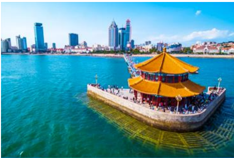
สะพานเคียนเฉียว

หลังอาหารนำท่านสัมผัสสัมผัสเสน่ห์ของหมู่บ้านชาวประมง ซาจื่อโข่ว 沙子口渔村 ให้ท่านได้ชมวิถีชีวิตดั้งเดิมกับทิวทัศน์ชายทะเล วิถีบ้านเรือนหลากสีที่ตั้งเรียงรายตามแนวชายฝั่งที่โดดเด่นด้วยเอกลักษณ์ ทำให้ หมู่บ้านซาจื่อโข่ว เป็นเอกลักษณ์เป็นจุดถ่ายภาพราวกับเมืองชายฝั่งของอิตาลีในยุโรป, จึงเป็นที่ดึงดูดให้นักท่องเที่ยวต่างอยากมาสัมผัสบรรยากาศ ณ หมู่บ้านชาวประมงซาจื่อโข่วแห่งนี้