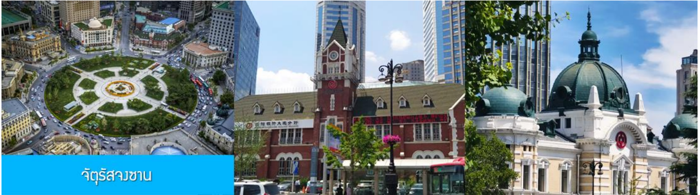
จัตุรัสสาขาน

เที่ยง รับประทานอาหารกลางวัน ณ ภัตตาคาร (11) ไกด์นำเสนโพรแกรมทัวร์เสริมหรือ OPTIONAL TOUR นั่งเรือใบออกทะเลเลี้ยงนกนางนวล ชมวิวชายฝั่งเมืองต้าเหลียน ใช้เวลาประมาณ 40 นาที + ขึ้นจุดชมวิวนบนเขาดอกบัว (เหลียนฮัวซาน) ชมทัศนียภาพแบบพาโนรามาของเมืองต้าเหลียน + ล่องเรือกอนโดล่าในสวนน้ำเวนิส อัตราค่าบริการท่านละ 500 หยวน หรือ 2,500 บาท อัตรานี้รวมค่าบัตร รถรับส่ง ค่าประกันอุบัติเหตุ และค่าบริการของไกด์ท้องถิ่น