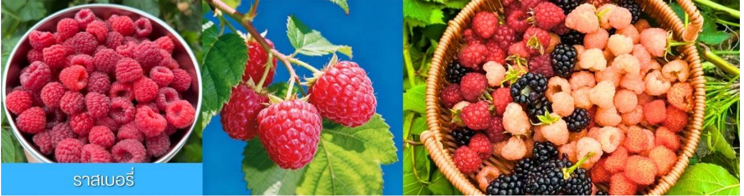
ราสเบอร์รี่

วันที่สอง เมืองต้าเหลียน-เก็บราสเบอร์รี่-ย่านถนนตงกวน-ถนนรัสเซีย-ถนนญี่ปุ่น-จัตุรัสชิงไห่ เช้า รับประทานอาหารเช้า ณ ห้องอาหารของโรงแรม (1) หลังอาหารนำท่านสู่ สวนราสเบอร์รี่ ให้ท่านสัมผัสประสบการณ์สุดชิล ด้วยการเด็ดราสเบอร์รี่สดจากต้นภายในสวนราสเบอร์รี่ (ในกรณีที่ผลน้อยหรือหมดเร็วกว่าปกติ ทางทัวร์ขอสงวนสิทธิ์ในการจัดโปรแกรมอื่นทดแทน)