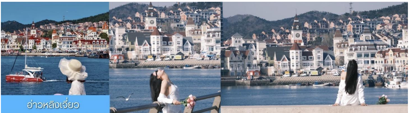
อ่าวหลิงเจี้ยว

จากนั้นนำท่าน ทิวชม ท่าเรือประมงหู่กาน 大连渔人码头 เป็นจุดเช็คอินที่โดดเด่นด้วยสถาปัตยกรรมสไตล์ยุโรปสีสดใส ผสมผสานกลิ่นอายเมืองท่าดั้งเดิมเข้ากับบรรยากาศสุดโรแมนติกที่เต็มไปด้วยเรือประมง คาเฟ่ ร้านอาหาร และจุดชมวิวยุริมาทะเล