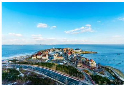
ท่าเรือชาวประมงไห่ฮวง

หมายเหตุ เรือท่องเที่ยวที่จองตัวได้ในแต่ละวันอาจมีเวลาแตกต่างกันในบางวัน บริษัทฯ ขอสงวนสิทธิ์ในการเปลี่ยนแปลงเวลาของเที่ยวเรือโดยมิแจ้งล่วงหน้า