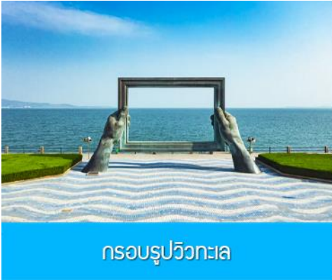
กรอบรูปวิวกทะเล