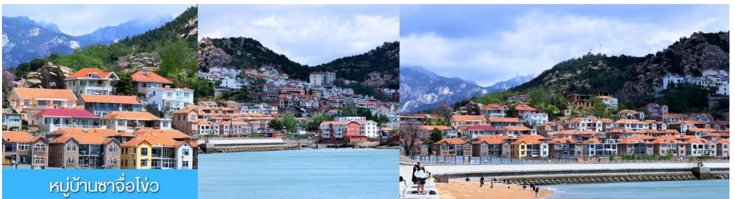
หมู่บ้านซาจื่อໂ໑

จากนั้นนำท่านเดินทางสู่ เมืองซิงเต่า 青岛 นำท่านสัมผัสสมนต์เสน่ห์ของหมู่บ้านชาวประมง ซาจื่อໂ໑ 沙子口 渔村 ให้ท่านได้ชมวิถีชีวิตดั้งเดิม กับทิวทัศน์ชายทะเล วิิวบ้านเรือนหลากสีที่ตั้งเรียงรายตามแนวชายฝั่งที่โดดเด่นด้วยเอกลักษณ์ ทำให้ หมู่บ้านซาจื่อໂ໑ เป็นเอกลักษณ์เป็นจุดถ่ายภาพราวกับเมืองชายฝั่งของอิตาลีในยุโรป, จึงเป็นที่ดึงดูดให้นักท่องเที่ยวต่างอยากมาสัมผัสบรรยากาศ ณ หมู่บ้านชาวประมงซาจื่อໂ໑แห่งนี้