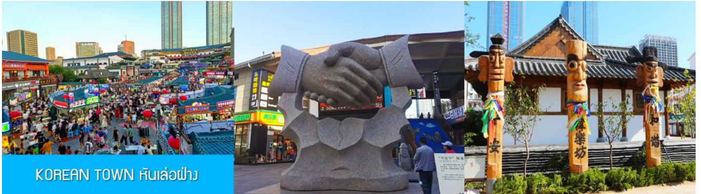
KOREAN TOWN หันเล่อฝ่าง

จากนั้นนำท่านสู่ ย่านเกาหลี KOREAN TOWN หันเล่อฝ่าง 韩乐坊 แหล่งท่องเที่ยวระดับ 3A ที่ชูคอนเซ็ปต์วัฒนธรรมเกาหลีของเมืองเวย์ไห่ ประกอบด้วยถนนคนเดินเกาหลี ประตุน้ำสี่ส่วย หอเฉลิมฉลอง และจัตุรัสวัฒนธรรมเล่นเทียยที่มีความโดดเด่นด้านสถาปัตยกรรม ให้ท่านได้เดินชม เก็บภาพ ลิ้มรสอาหารพื้นเมืองในย่านเกาหลีได้อย่างเต็มอิ่ม..