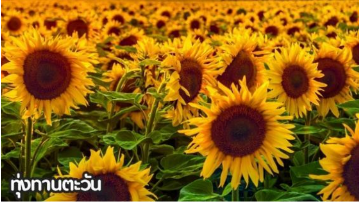
ทุ่งทานตะวัน