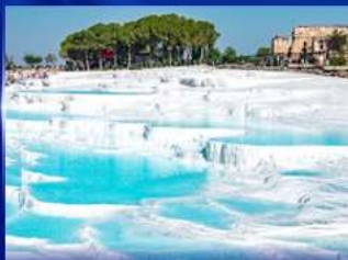
ปราสาทขุยฉ้าย ปามุกคาล