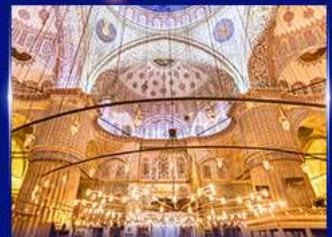
เข้าชมความงามสุเหร่าสีน้ำเงิน