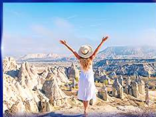
ชมความงดงาม หุบเขาแห่งรัก