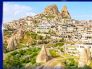
หุบเขาอูซชิซาร์ คัมปาโดเกีย