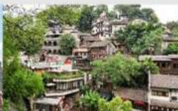
ตรอกโบราณเซี่ยฮ่าวหลี่