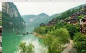
เมืองโบราณกงถาน