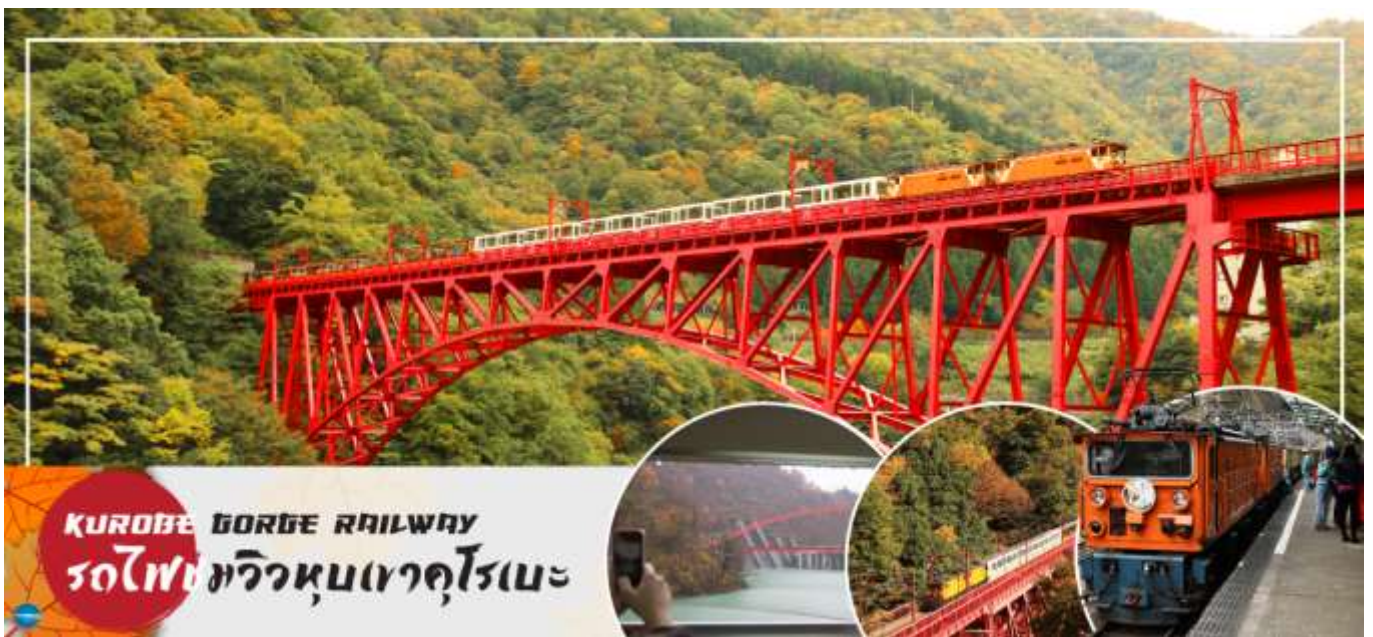
KUROBE GORGE RAILWAY รถไฟชมวิวยายฝั่งอามาสาราชิ

วันที่สาม เมืองโทนามิ - เมืองคุโรเบะ - สถานีอุนาซึกิ - นั่งรถไฟชมวิวหุบเขาคุโรเบะ - เมืองโทนามิ - จุดชมวิวยายฝั่งอามาสาราชิ - อีออนมอลล์ โทนามิ