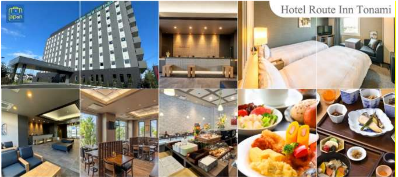
Hotel Route Inn Tonami

วันที่สาม เมืองโทนามิ - เมืองคุโรเบะ - สถานีอุนาซึกิ - นั่งรถไฟชมวิวหุบเขาคุโรเบะ - เมืองโทนามิ - จุดชมวิวยายฝั่งอามาสาราชิ - อีออนมอลล์ โทนามิ