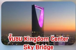
เข้าชม Kingdom Center Sky Bridge