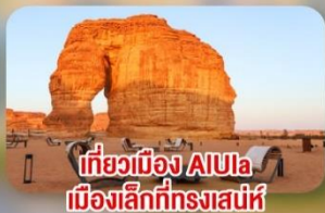
เที่ยวเมือง Alula เมืองเล็กที่ทรงเสน่ห์