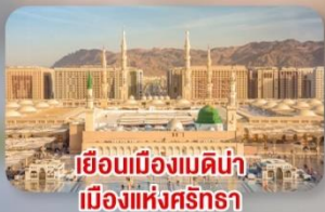
เยือนเมืองเมดีน่า เมืองแห่งศรัทธา