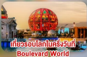
เที่ยวระดับโลกในครั้งวันที่ Boulevard World