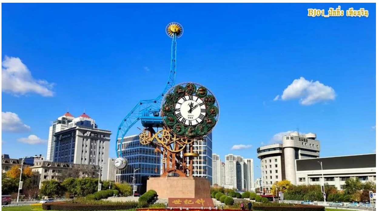
BJ01_ปักกิ่ง เทียนจิน

จากนั้นนำท่านไปชม “ หอนาฬิกาแห่งศตวรรษ ” (TIANJIN CENTURY CLOCK) แลนด์มาร์คสำคัญเมืองเทียนจิน ที่มีการออกแบบที่สวยงามสไตล์ยุโรปผสมผสานสถาปัตยกรรมจีนที่โดดเด่น ถือว่าเป็นประติมากรรมเหล็กขนาดใหญ่ ริมแม่น้ำไห่เหอ สร้างขึ้นเมื่อ ค.ศ. 2000 เพื่อเฉลิมฉลองศตวรรษใหม่ โดดเด่นด้วยการออกแบบสไตล์ยุโรปผสมผสานศิลปะจีน (รูปทรงตัว S สื่อถึงหยิน-หยาง) โครงสร้างเหล็กสูง 40 เมตร สีดำ พร้อมสัญลักษณ์ 12 ราศี และหน้าปัดเลขโรมัน เป็นสัญลักษณ์ที่เชื่อมโยงประวัติศาสตร์อันยาวนานของจีนเข้ากับโลกยุคใหม่