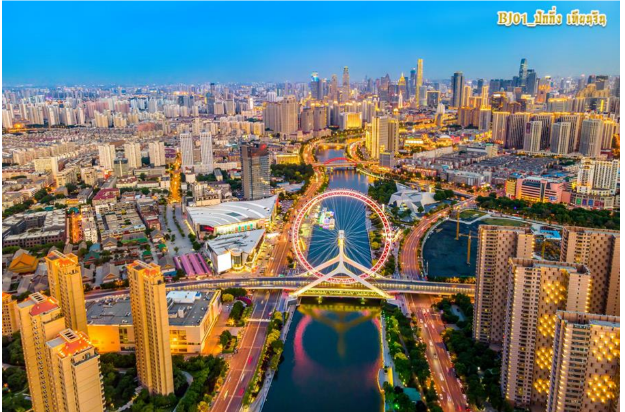
BJ01_ปักกิ่ง เทียนจิน

จากนั้นนำท่านไปชม “ หอนาฬิกาแห่งศตวรรษ ” (TIANJIN CENTURY CLOCK) แลนด์มาร์คสำคัญเมืองเทียนจิน ที่มีการออกแบบที่สวยงามสไตล์ยุโรปผสมผสานสถาปัตยกรรมจีนที่โดดเด่น ถือว่าเป็นประติมากรรมเหล็กขนาดใหญ่ ริมแม่น้ำไห่เหอ สร้างขึ้นเมื่อ ค.ศ. 2000 เพื่อเฉลิมฉลองศตวรรษใหม่ โดดเด่นด้วยการออกแบบสไตล์ยุโรปผสมผสานศิลปะจีน (รูปทรงตัว S สื่อถึงหยิน-หยาง) โครงสร้างเหล็กสูง 40 เมตร สีดำ พร้อมสัญลักษณ์ 12 ราศี และหน้าปัดเลขโรมัน เป็นสัญลักษณ์ที่เชื่อมโยงประวัติศาสตร์อันยาวนานของจีนเข้ากับโลกยุคใหม่