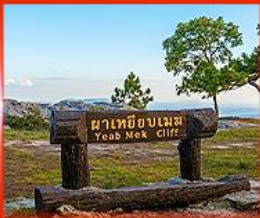
ผาเหยียบเมฆ