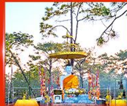
พระพุทธรูปเมตตา ลานพระแก้ว