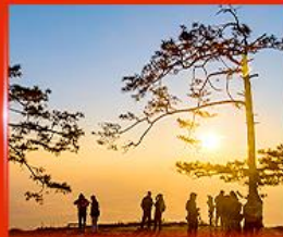
ผานกแอ่น