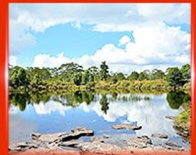
สระอินตาต