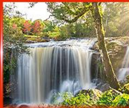
น้ำตกเพ็ญพบใหม่