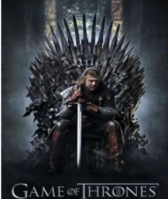
GAME OF THRONES