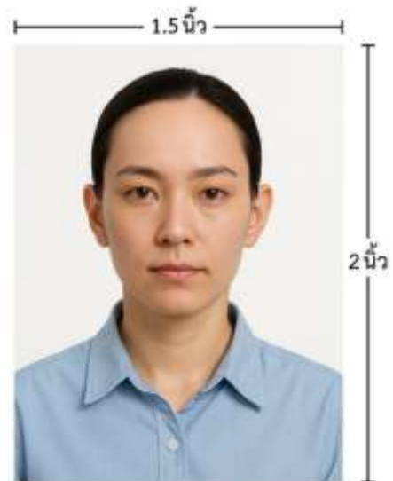
ขนาดรูปตัวอย่างใช้ยื่น Visa

*** ห้ามขีดเขียน แม็ก หรือใช้คลิปลวดหนีบกระดาษ ซึ่งอาจส่งผลให้รูปถ่ายชำรุด และไม่สามารถใช้งานได้ ***