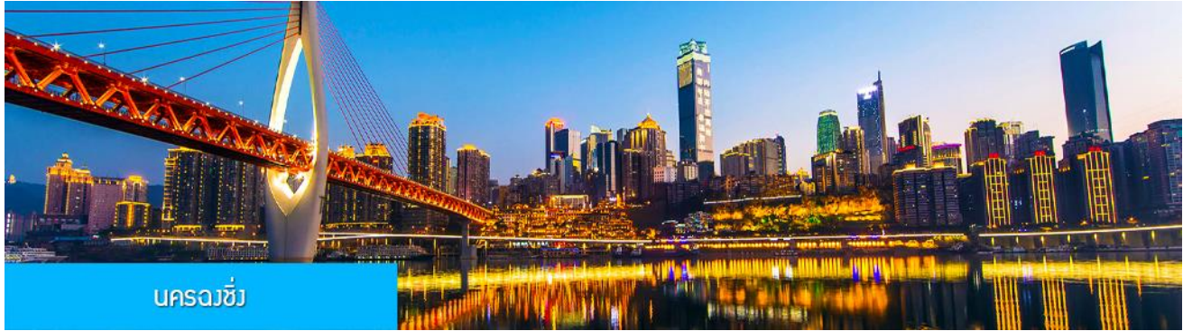
นครฉงชิ่ง