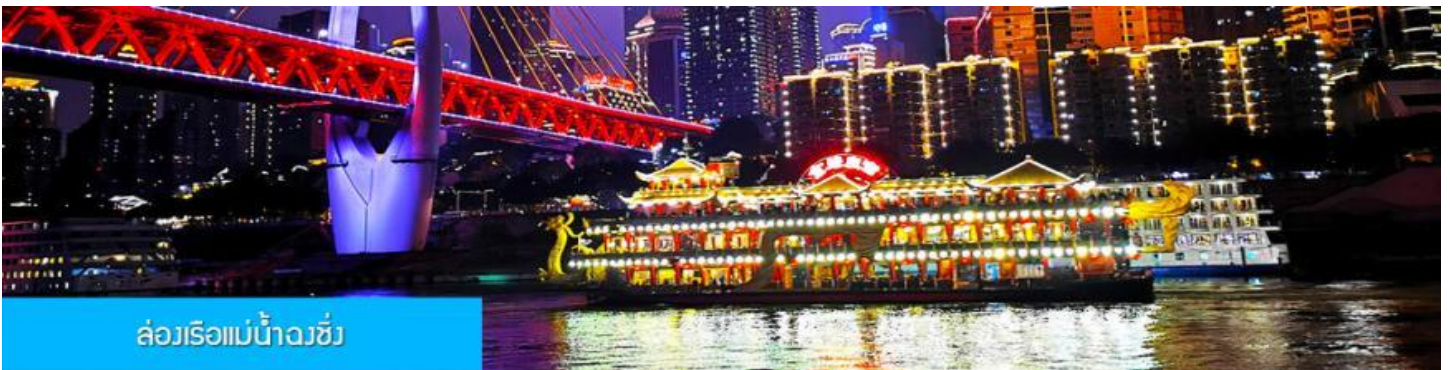
ล่องเรือแม่น้ำฉงชิ่ง