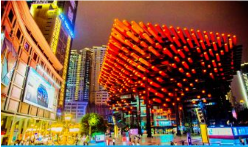
หอศิลป์กัวโก