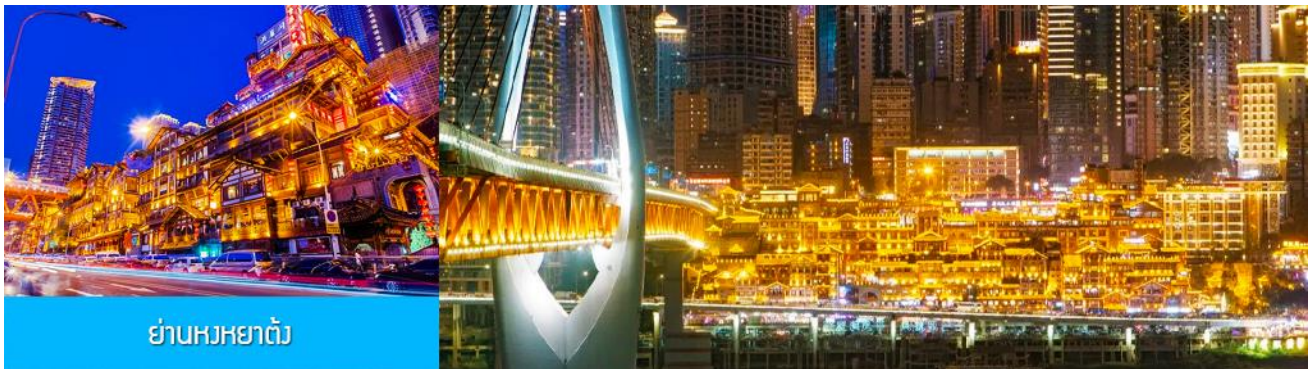
ย่านหงหยาดัง

นำท่านเที่ยวชม ย่านหงหยาดัง 洪崖洞 สถานที่แห่งนี้เดิมเป็นประตูเมืองโบราณ ปัจจุบันได้ถูกพัฒนามาเป็นแหล่งท่องเที่ยวที่รวมเอา จุดชมวิว สถานที่เช็คอิน ร้านอาหาร ร้านกาแฟ ร้านจำหน่ายสินค้าพื้นเมืองและของที่