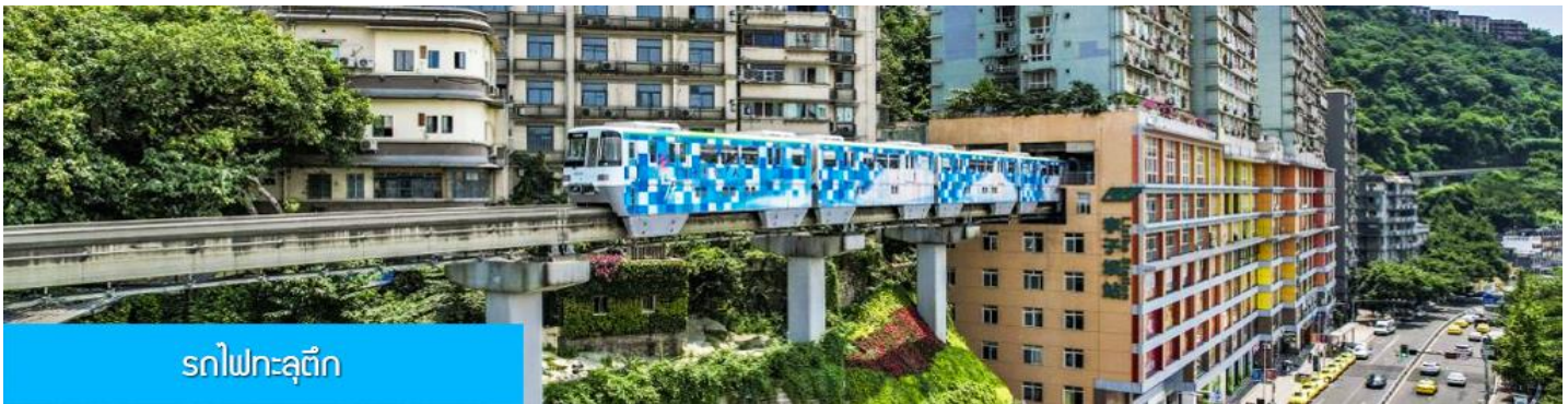
รถไฟทะเลตึก

พักที่ HOLIDAY INN EXPRESS HOTEL โรงแรมระดับ 4 ดาวหรือเทียบเท่า เมืองฉงชิ่ง