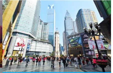
ย่านเจียฟางเปย

วันที่สาม ฉงชิ่ง-ร้านผลิตภัณฑ์ยางพารา -The Ring Mall of Hongkong Land's Yorkville-ถนน โบราณริมผา(ซอยหน้าผา) ตึกตะเกียบ-ถนนคนเดินเจียฟางเปย-โกดังขายออฟชั่น ละครจีนตุนิมิต สุดอลังการเรื่อง แม่น้ำแยงซี+สุกี้หมาล่า