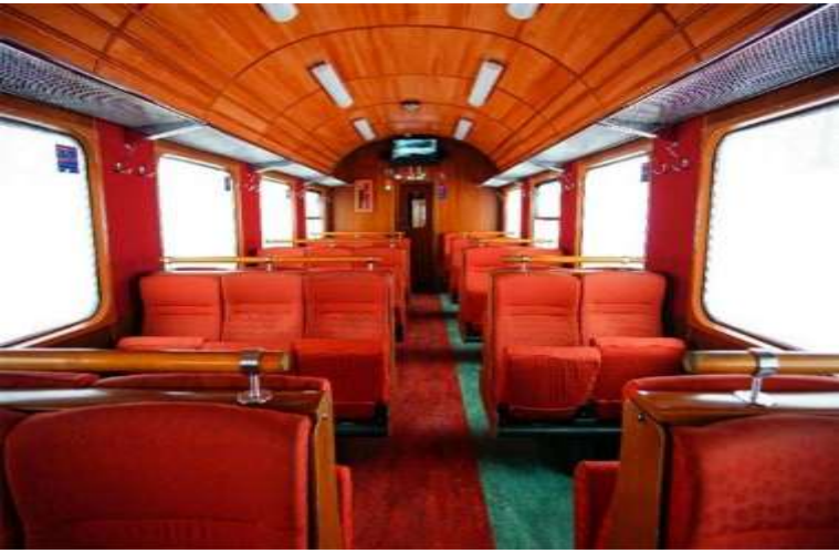
ที่ท่านจะไม่มีวันลืม

หุบเขาลึก, น้ำตกที่พุ่งลงมาจากหน้าผาสูงชัน, และ ยอดเขาที่ปกคลุมด้วยหิมะขาวโพลน ท่ามกลาง ฟาร์มเล็กๆ ที่ตั้งอยู่บนเนินเขา สะท้อนถึงวิถีชีวิตเรียบง่ายท่ามกลางธรรมชาติอันยิ่งใหญ่ รถไฟฟลัมสบานา เปิดให้บริการมาตั้งแต่ปี ค.ศ. 1940 และได้กลายเป็นหนึ่งในสัญลักษณ์ของการท่องเที่ยวเชิงธรรมชาติที่สำคัญที่สุดของประเทศนอร์เวย์ ระหว่างทาง รถไฟจะหยุดให้ ทุกท่านได้สัมผัสความอลังการของ “น้ำตกคือสฟอสเซ่น” (Kjosfossen) น้ำตกสูงกว่า 225 เมตร ที่ปล่อยสายน้ำตกกระแทกโขดหินเบื้องล่างอย่างทรงพลัง พร้อมให้ท่านได้เก็บภาพประทับใจและรับไอเย็นจากละอองน้ำตกอย่างใกล้ชิด เส้นทาง Flåmsbana ในวันนี้จะเป็นอีกหนึ่งไฮไลท์แห่งการเดินทาง