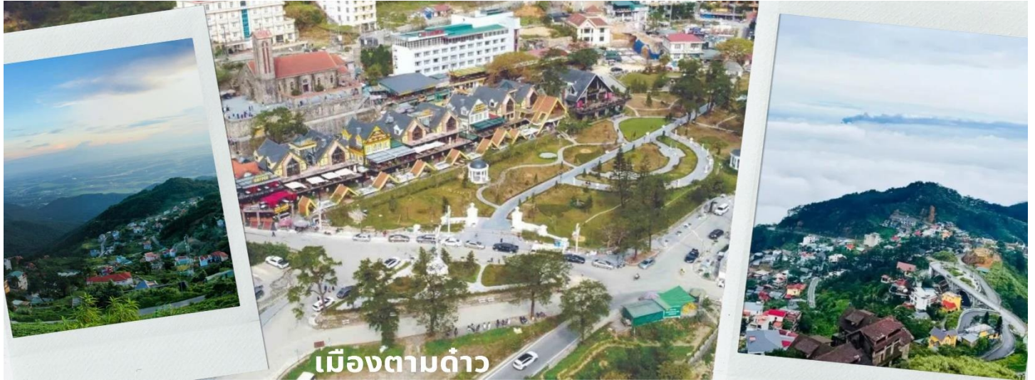
เมืองตามด้าว

จากนั้นนำท่านเดินทางขึ้น ตามด้าว Tam Dao (ใช้ระยะเวลาประมาณ 1 ชม 30 นาที) เป็นเมืองตากอากาศที่ตั้งอยู่ทางตอนเหนือของเวียดนาม ในจังหวัดหวิญฟุก (Vinh Phuc) ห่างจากฮานอยประมาณ 80 กิโลเมตร ที่ระดับความสูงประมาณ 900 เมตรเหนือระดับน้ำทะเล ทำให้สภาพอากาศค่อนข้างเย็นสบายตลอดทั้งปี มีความเงียบสงบ ธรรมชาติอุดมสมบูรณ์ เหมาะกับคนที่อยากหนีร้อนจากในเมืองมาพักผ่อนชิลๆ และที่นี่ยังถูกเรียกว่า Little Sapa และ ดาลัดแห่งภาคเหนือ เนื่องจากเป็นเมืองกลางสายหมอกในหุบเขา และมีความเป็นยุโรปคล้ายกับซาปา