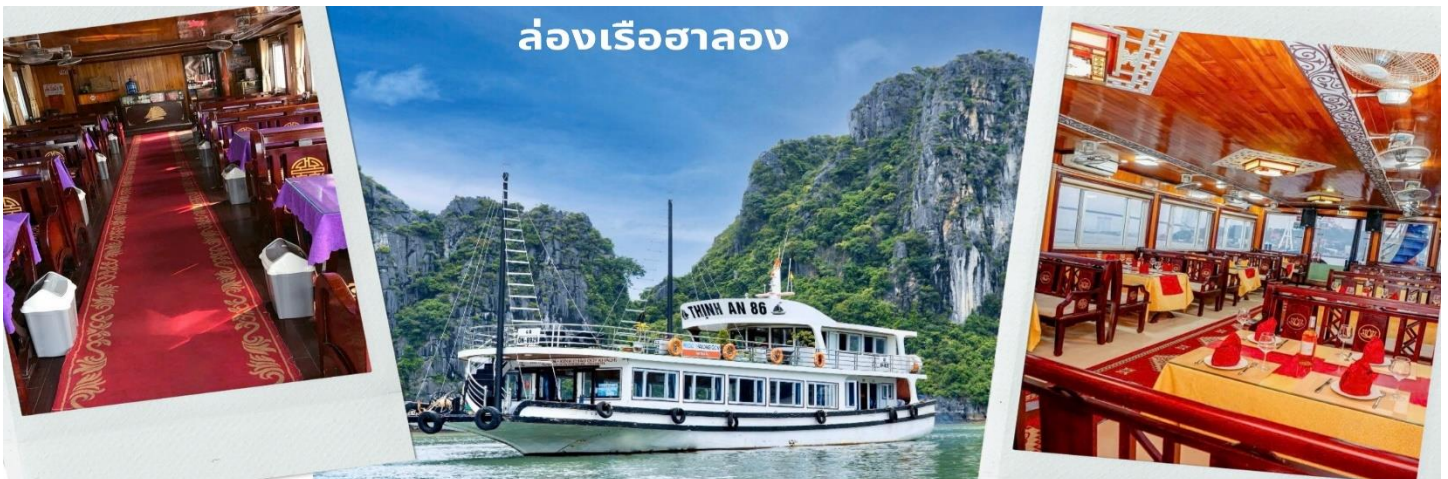
ล่องเรือฮาลอง

ท่าน ล่องเรือชมอ่าวฮาลองเบย์ ที่มีพื้นที่กว้างใหญ่กว่า 1,500 ตารางกิโลเมตร อยู่ทางตอนเหนือของเวียดนาม และเป็นส่วนหนึ่งในอ่าวตังเกี๋ย มีชายฝั่งยาวเป็นระยะทางกว่า 120 กิโลเมตร ท่านจะพบกับวิวทิวทัศน์ หันมองไปทางไหนก็สวยงาม เห็นผืนน้ำสีเขียวสวยและหมู่เกาะหินปูนน้อยใหญ่โผล่ขึ้นมาจากผิวน้ำทะเลที่มีลักษณะแตกต่างกันออกไป ถือเป็นสถานที่ที่เยี่ยมชมธรรมชาติของเวียดนามอีกแห่งหนึ่งที่สามารถดึงดูดนักท่องเที่ยวมากมายจากทั่วทุกมุมโลกให้มาเยือนสถานที่แห่งนี้