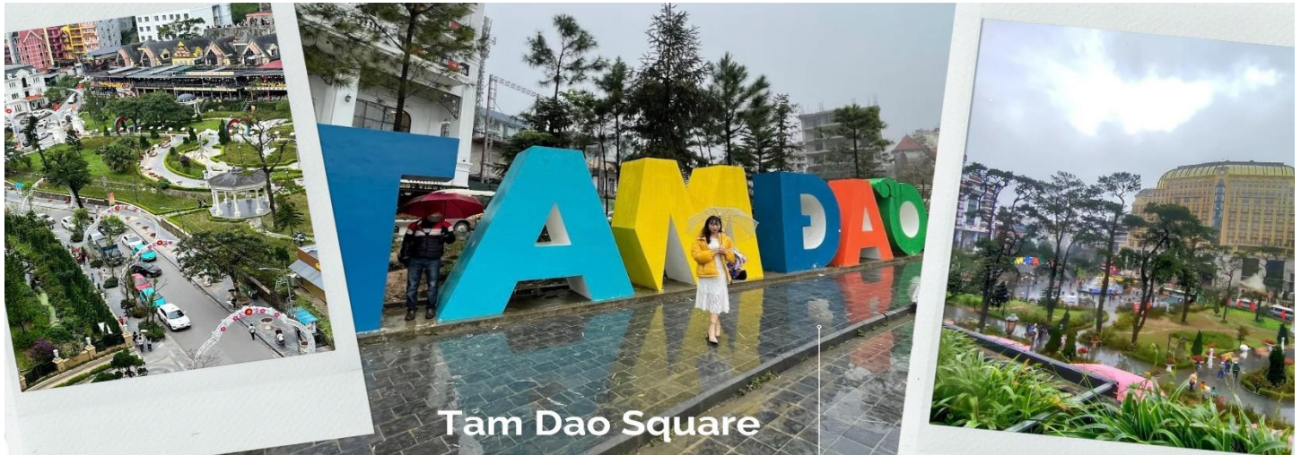
Tam Dao Square

นำท่านสู่ จัตุรัสตามด้าว ตั้งอยู่ใจกลางเมือง โดดเด่นด้วยน้ำพุขนาดใหญ่ รายล้อมไปด้วยร้านค้า ร้านอาหาร โรงแรม และคาเฟ่มากมาย บางวันมีการแสดงดนตรีสดให้ได้ชม บรรยากาศคึกคักมาก และไฮไลต์ที่พลาดไม่ได้ก็คือ ป้ายขนาดใหญ่ที่เขียนว่า “ Tam Dao ” เป็นจุดที่นักท่องเที่ยวนิยมมาถ่ายรูปกัน ถือเป็น打卡อินที่มาถึงตามด้าวแล้ว