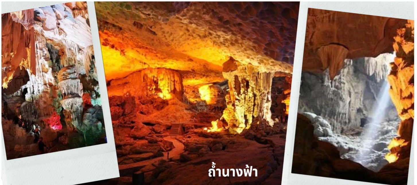
ถ้ำนางฟ้า

ระหว่างล่องเรือเที่ยวชม ถ้ำสวรรค์ (Thien Cung Cave) หรืออีกชื่อ “ถ้ำนางฟ้า” พาท่านชมหินงอกหินย้อยแห่งอ่าวฮาลองที่มีอายุนับล้านปี มีโครงสร้างสลับซับซ้อนกันหลายชั้นพร้อมประดับไฟไว้อย่างสวยงาม ภายในถ้ำจะเห็นได้ว่าหินงอกหินย้อยต่าง ๆ นั้นจะมีลักษณะรูปร่างแตกต่างกันออกไปตามแต่ท่านจะจินตนาการ ขึ้นอยู่ว่าแต่ละท่านจะตีความออกมาว่าเป็นรูปร่างเหมือนสิ่งใด ในถ้ำเราจะเห็นหินรูปร่างฟ้าที่ถูกสร้างขึ้นมาจากทางธรรมชาติที่ติดอยู่ภายในผนังถ้ำ นับว่าเป็นสิ่งมหัศจรรย์อย่างหนึ่งและมีตำนานเล่าขานกันว่า มีเหล่านางฟ้าเข้ามาอาบน้ำในถ้ำแห่งนี้และเกิดหลงไหลชายหนุ่มผู้ที่เป็นมนุษย์เลยคิดที่จะไม่ยอมกลับไปสวรรค์ จนกระทั่งเวลาผ่านไป ล่วงเลยไปกลุ่มนางฟ้าทั้งหลายเลยกลายเป็นหินติดอยู่ที่ผนังถ้ำอย่างน่าอัศจรรย์