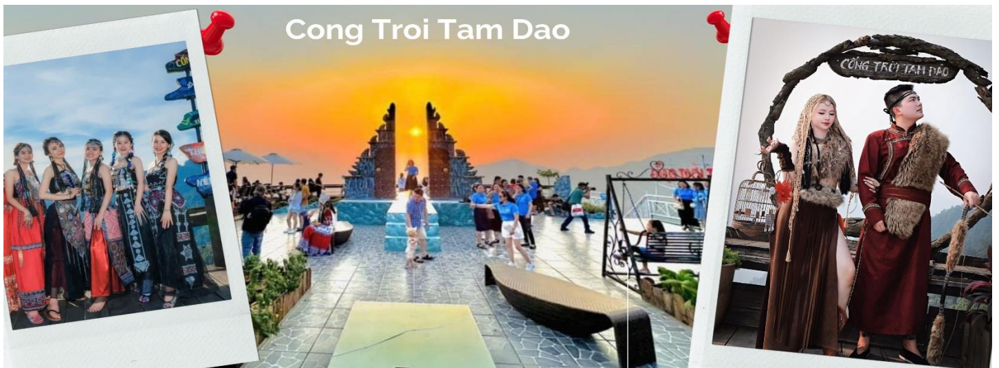
Cong Troi Tam Dao

นำท่านชม ร้านกาแฟ Cong Troi Tam Dao คือหนึ่งในจุดเช็คอินที่โดดเด่นที่สุดในเมืองตามด้าวตั้งอยู่บนยอดเนินเขาที่สามารถมองเห็นวิวเมืองตามด้าวได้ทั้งเมือง สถาปัตยกรรมที่นี่ มีกลิ่นอายแบบยุโรปคลาสสิกด้วย ชุมประตูดิน ทรงโค้งที่ตั้งตระหง่านอยู่ริมหน้าผา เปรียบเสมือนกรอบรูปขนาดยักษ์ที่ล้อมรอบทิวทัศน์ของขุนเขาและทะเลหมอกเอาไว้ โดยเฉพาะในช่วงเช้าและช่วงเย็นที่หมอกจะไหลผ่านชุมประตูดิน ทำให้บรรยากาศดูสิ่กลับ