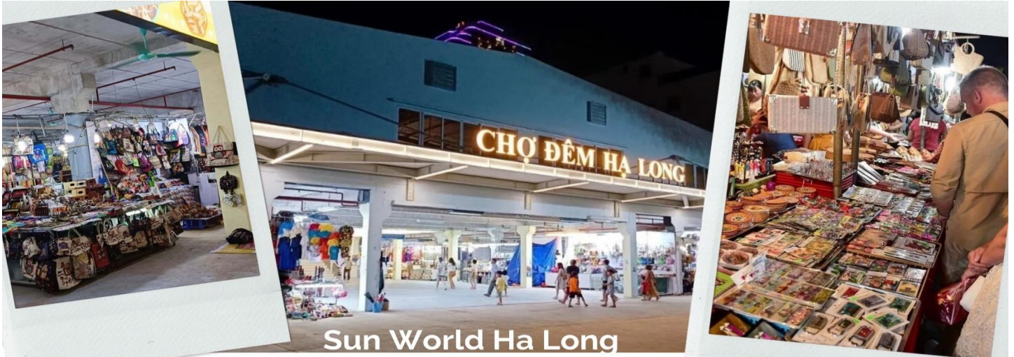
Sun World Ha Long

จากนั้นนำท่านไป ตลาดกลางคืนฮาลอง ไม่เพียงแต่เป็นสวรรค์แห่งอาหารและการช้อปปิ้งเท่านั้น แต่ยังเป็นสถานที่ที่เก็บรักษาจิตวิญญาณทางวัฒนธรรมของดินแดนแห่งมรดกโลกกว้างนิญอีกด้วย ที่นี่ นักท่องเที่ยวจะได้สัมผัสกับบรรยากาศที่คึกคัก ลิ้มลองอาหารท้องถิ่นรสเลิศ และเลือกซื้อของที่ระลึกที่สะท้อนถึงความเป็นทะเลอย่างแท้จริง ทุกมุมของตลาดล้วนซ่อนเร้นเสน่ห์อันเป็นเอกลักษณ์ – ตั้งแต่กลิ่นหอมเย้ายวนของอาหารปิ้งย่าง เสียงจอแจของการซื้อขาย ไปจนถึงแสงไฟระยิบระยับที่สะท้อนบนพื้นถนนยามค่ำคืน