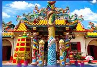
วัดศาลเจ้าท่ามกั้งเขีย