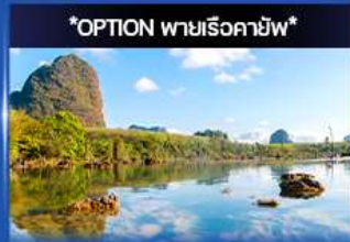
คลองหurut (คลองน้ำใส)