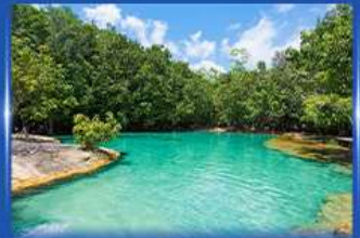
สระมรกต กระบี่