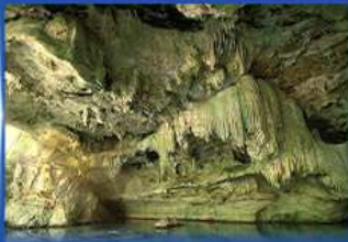
ถ้ำเขาจอม Unseen Thailand