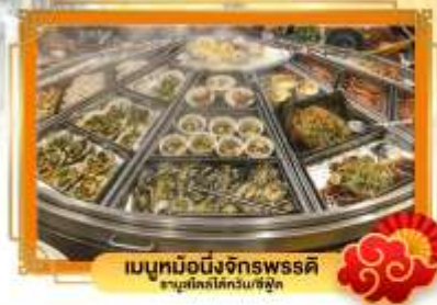
เมนูหม้อนึ่งจักรพรรดิ