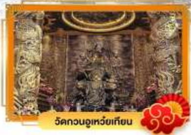
วัดกวนอูเหว่ยเทียน