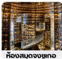
ห้างสมุดจวงซูเกอ