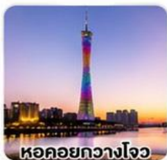
หอคอยกว้างใจ