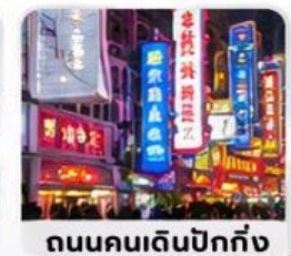
ถนนคนเดินปิกกิง