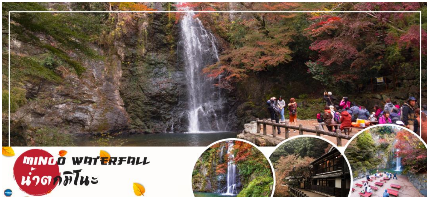
MINOH WATERFALL น้ำตกมิโนะ

วันที่ทำ เมืองโอซาก้า - เมืองมิโนะ - น้ำตกมิโนะ - วัดคัตสึโอะจิ - เมืองโอซาก้า - ปราสาทโอซาก้า(ด้านนอก) - ช้อปปิ้งชินไซบาชิ