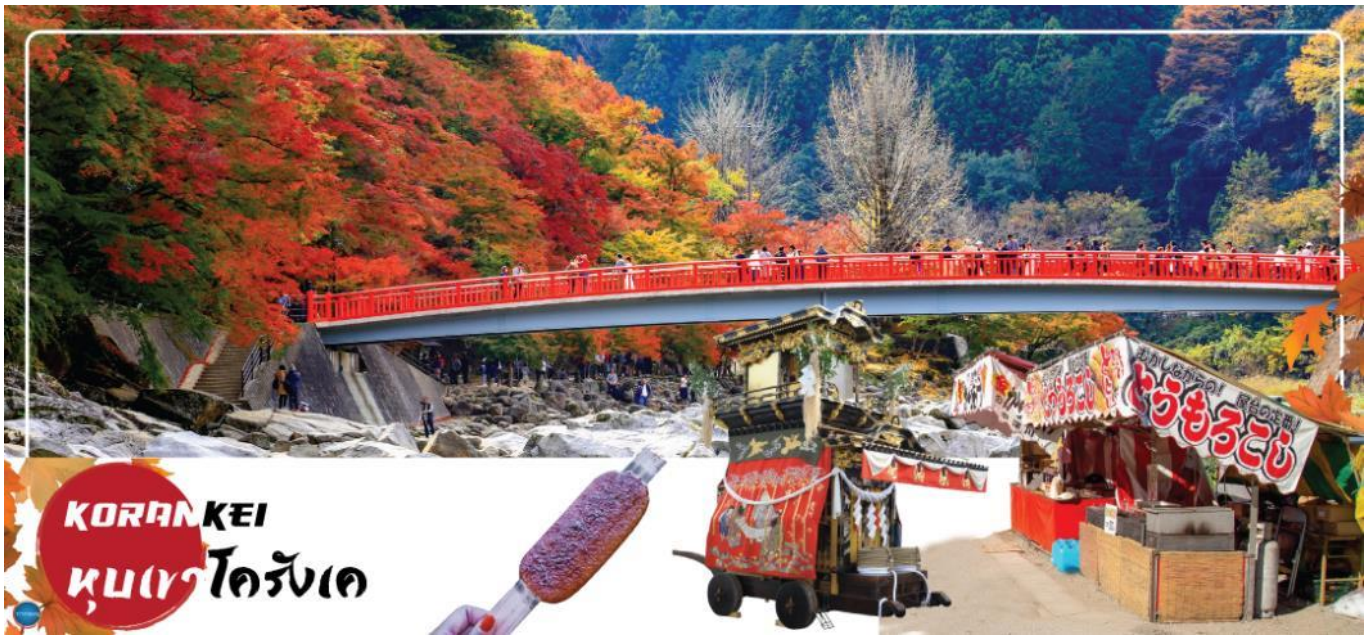
KORANKEI หุบเขาโครังเค

วันที่สาม เมืองนาโกย่า - หุบเขาโครังเค - โอบาระ - หมู่บ้านซากุระสีฤดูความิ - เกะโระ - สะพานเกะโระโอสฮาชิ - ออนเซ็นฟุนเซ็นจิ - เมืองนาโกย่า - ย่านซาคาเอะ