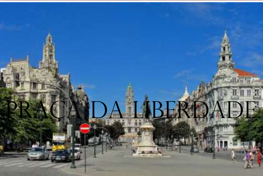
PRAÇA DA LIBERDADE