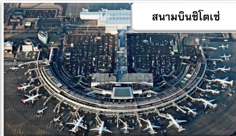
สนามบินชิโตเซ่

บริการอาหารร้อนบนเครื่องพร้อมกับเมนูผลไม้สดเพื่อเติมเต็ม ความพิเศษไปพร้อมกับความสดชื่น