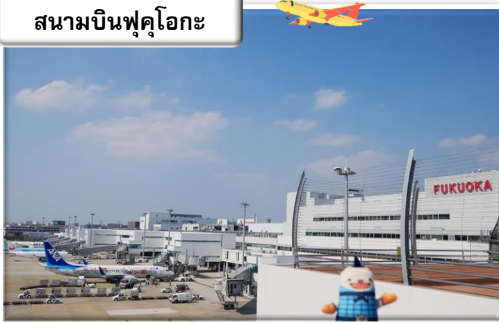
สนามบินฟุคุโอกะ

เวลา 00.55 น. ออกเดินทางสู่ สนามบินฟุคุโอกะ ประเทศ ญี่ปุ่น โดย สายการบินไทย เที่ยวบินที่ T5648