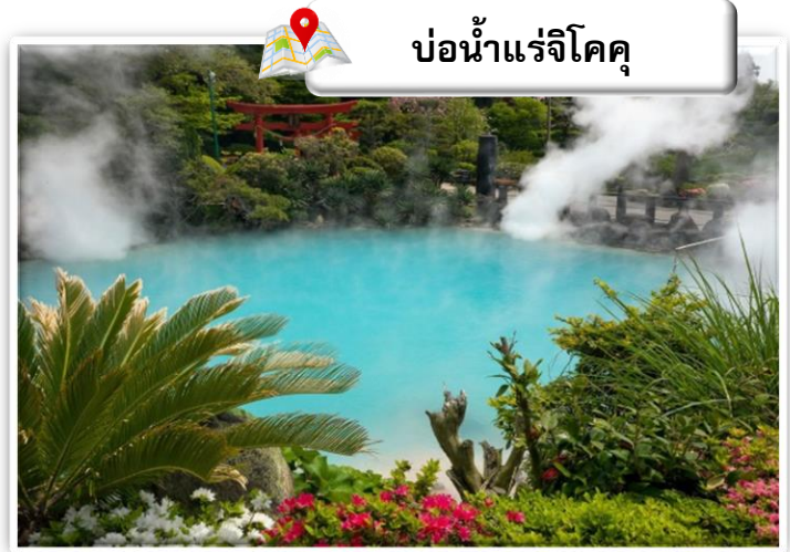
บ่อน้ำแร่จิโคคุ

เดินทางสู่ บ่อน้ำพุร้อน (Jigoku Meguri) หรือ บ่อน้ำพุร้อนชุมชนรอกทั้งแปด เป็นบ่อน้ำพุร้อนธรรมชาติที่เกิดขึ้นภายหลังจากการระเบิดของภูเขาไฟ ประกอบไปด้วยแร่ธาตุที่เข้มข้น เช่น กำมะถัน แร่เหล็ก โซเดียม คาร์บอเนต เรเดียม เป็นต้น และร้อนเกินกว่าจะลงไปอาบได้ แล้วบ่อทั้ง 8 บ่อ ก็ตั้งชื่อให้หน้ากลัวตามลักษณะภายนอกที่เห็นกัน