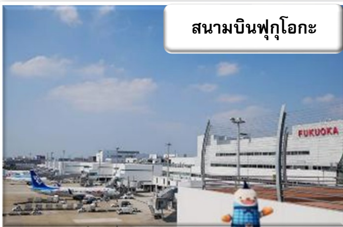
สนามบินฟูกูโอกะ

เวลา 00.50 น. ออกเดินทางสู่ สนามบินฟูกูโอกะ ประเทศญี่ปุ่น โดยสายการบินไทย เที่ยวบินที่ TG 648 เวลา 08.00 น. เดินทางถึง สนามบินฟูกูโอกะ ประเทศญี่ปุ่น นำท่านผ่านขั้นตอนการตรวจคนเข้าเมืองและศุลกากร