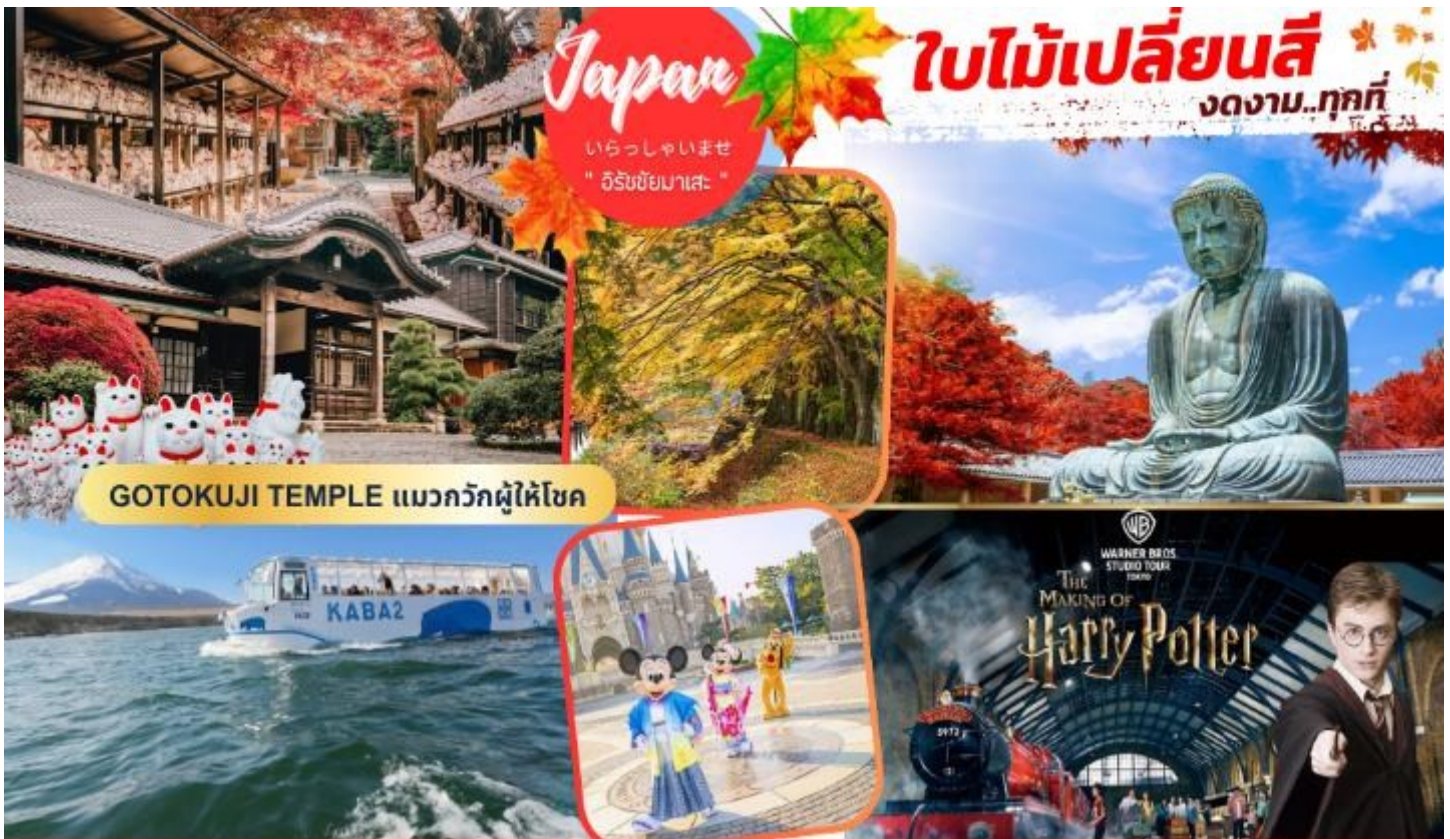
GOTOKUJI TEMPLE แมวกวักผู้ให้โชค

กำหนดการเดินทาง : 06 – 12 พฤศจิกายน 2569