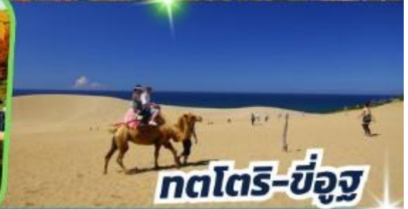
ทตโตริ-ซ็องสุ