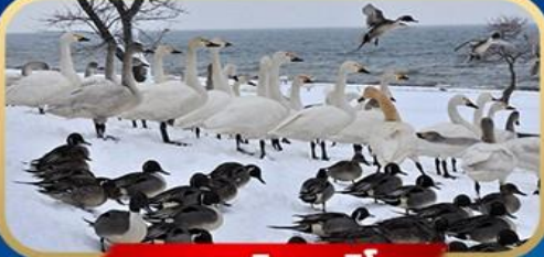
ทะเลสาบอินาวะชิโร