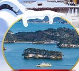
อ่าวมิดสึชิม่า