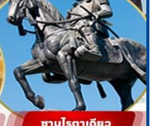
ซาบูโรตาเคียว