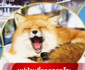
หมู่บ้านจิ้งจอกซาโอะ