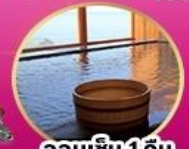
ออนเซ็น 1 คืน