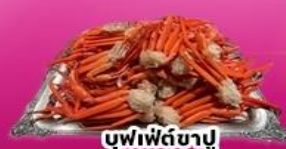
บุฟเฟ่ต์ขาปู