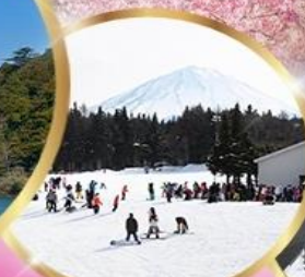
ลานสกีฟูจิเท็น