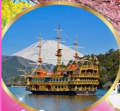
ล่องเรือทะเลสาบอาชิ