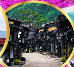
นาราจุกุ