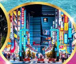
ช้อปปิ้งชินจุกุ