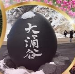
หุบเขาโอวาคุดานิ