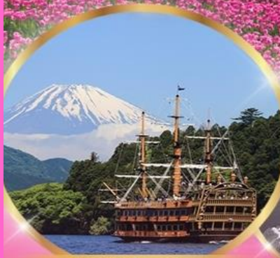
ล่องเรือโจรสลัด