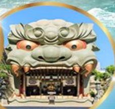
ศาลเจ้านิมะ ยาชากะ