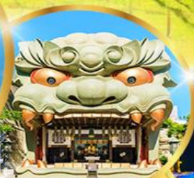
ศาลเจ้า นัมมะ ยาชากะ