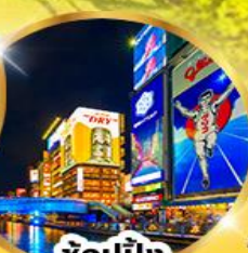
ช้อปปิ้ง ชินโซบาชิ