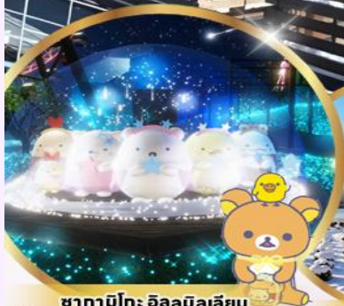
ซากาามิโกะ อิลลูมินาเลี่ยน ธันตาร์ตูนสุดน่ารักจากค่าย SAN-X