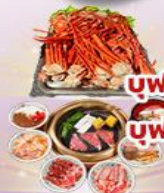
บุฟเฟต์ ชาปู 1 มื้อ

ราคา เริ่มต้น 39,919 บาท รวมภาษีมูลค่าเพิ่ม 7%