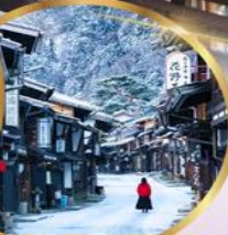
หมู่บ้านโบราณ นาราอิ จุกุ

ราคา เริ่มต้น 39,919 บาท รวมภาษีมูลค่าเพิ่ม 7%