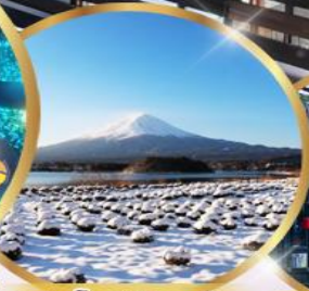
สวน ไออิชิ พาร์ค