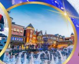
โรงงานช็อคโกแลต ชิโรอิ โคอิมีโตะ