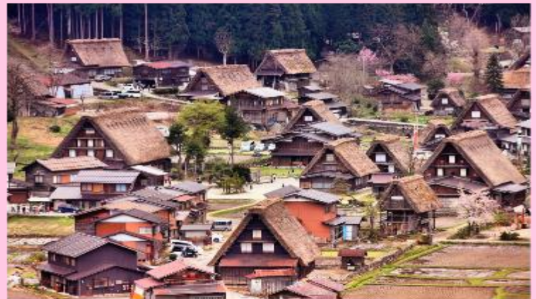
รูปใช้เพื่อประกอบการโฆษณาเท่านั้น