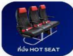
ที่นั่ง HOT SEAT