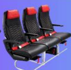
ที่นั่ง HOT SEAT