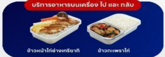
บริการอาหารบนเครื่อง ไป และ กลับ