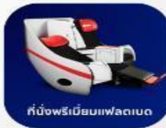
ที่นั่งพรีเมียมแฟลตเบด