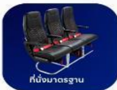
ที่นั่งมาตรฐาน