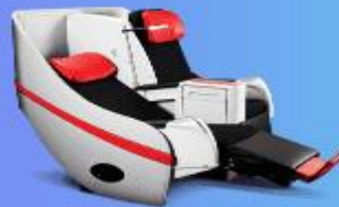
พรีเมียมเฟลตเบด