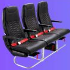
ที่นั่งมาตรฐาน

12.05 น. ออกเดินทางสู่ เมืองโอซาก้า ประเทศญี่ปุ่น โดยสายการบิน THAI AIR ASIA X (XJ) เที่ยวบินที่ XJ610