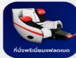
ที่นั่งพรีเมียมเฟลทเบด