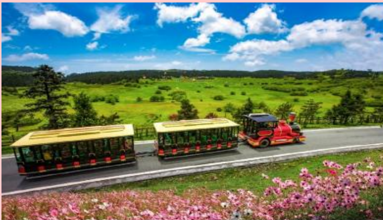
FAIRY MAIDEN MOUNTAIN

จากนั้นนำท่านเดินทางสู่ อุทยานเขานางฟ้า (Fairy Maiden Mountain) อุทยานท่องเที่ยวทางธรรมชาติของเมืองอู่หลง ที่ถือว่าอยู่ในระดับ 5A ของประเทศจีน ที่อุทยานแห่งนี้ได้รับการกล่าวขานว่าเป็นอุทยานที่มีชื่อเสียงในเรื่องของความสวยงามทางธรรมชาติสามารถท่องเที่ยวได้ทั้งปี หลังจากนั้นนำท่านเดินทางกลับสู่ เมืองฉงชิ่ง (Chongqing)