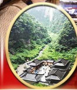
อุทยานหลุมฟ้า สะพาน สวรรค์