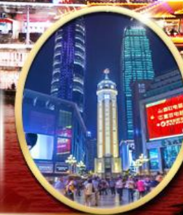
ถนนคนเดินเจี๋ยฟางเป็ย