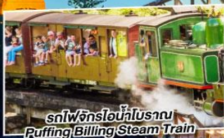
รถไฟจักรไอน้ำโบราณ Puffing Billington Steam Train