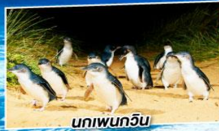
นกเพนกวิน