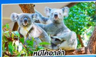
หมีโคอาล่า

ออสเตรเลีย ซิดนีย์ เมลเบิร์น 7 วัน 4 คืน