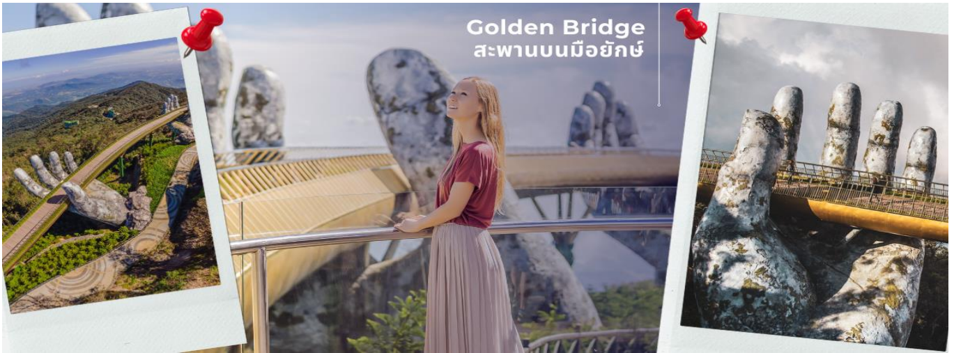
Golden Bridge สะพานบนมือยักษ์

CFDD3 ดานัง-ฮอยอัน-พักบานาฮิลล์ 3 วัน 2 คืน FD (APR-OCT24)