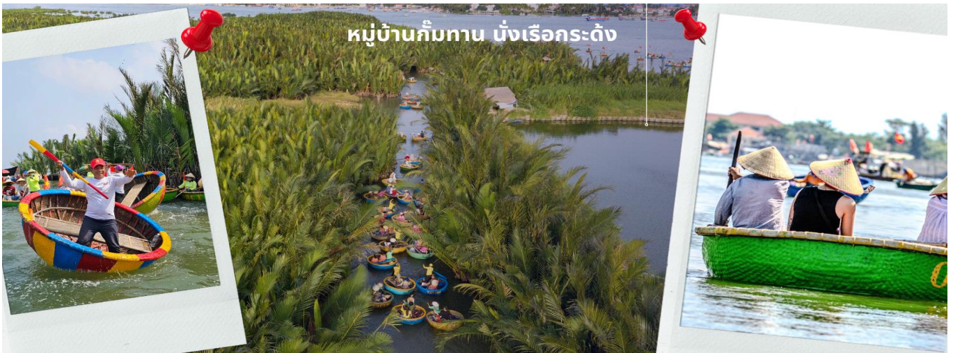
หมู่บ้านกิมทาน นั่งเรือกระดง

จากนั้นนำท่านผ่านชม ภูเขาหินอ่อน Marble Mountains และนำท่านเข้าชม หมู่บ้านแกะสลักหินอ่อน ที่มีแหล่งวัดอุทิศหินอ่อนเนื้อดี และช่างแกะสลักฝีมือประณีต ส่งออกจำหน่าย ทั่วโลก จากนั้นนำท่านเดินทางสู่ หมู่บ้านกิมทาน สนุกสนานไปกับการเล่นกิจกรรม นั่งเรือกระดง เป็นหมู่บ้านเล็กๆ ในเมืองฮอยอันตั้งอยู่ในสวนมะพร้าวริมแม่น้ำ ในอดีตช่วงสงครามที่นี่เป็นที่พักอาศัยของเหล่าทหาร อาชีพหลักของคนที่นี่คืออาชีพ