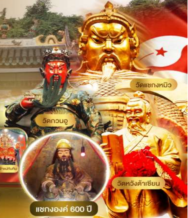
วัดแซงหมิว