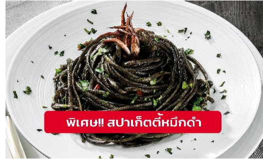
พิเศษ!! สปาเก็ตตี้หมึกดำ

Highlight! เมื่อเยือนเกาะเวนิส เมนูที่ขึ้นชื่อและหากได้มาต้องได้ลิ้มลอง สปาเก็ตตี้ผัดซอสหมึกดำที่คลุกเคล้ากับความหอมนุ่มนวลกับบรรยากาศ