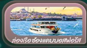
ล่องเรือ ช่องแคบบอสฟอรัส