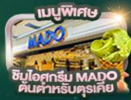
ช้อปปิ้ง MADO สินค้าสำหรับตุรกี