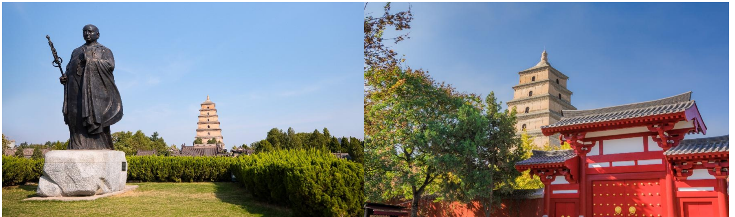
กวางพันเล่ม

จากนั้นนำท่านเดินทางสู่ เจดีย์ห้าชั้น แห่งวัดฉือเอิน สร้างเสร็จในปีค.ศ. 652 โดย ถังเกาจง(หลี่จื้อ) ฮองเต๋องค์ที่สาม แห่งราชวงศ์ถัง และ ได้นิมนต์พระภิกษุสามจั้ง หรือรู้จักในนามพระถังซัมจั๋ง พระเถระที่มีชื่อเสียงที่สุดในสมัยถัง ซึ่งใช้เวลากว่า 15 ปีจาริกไปถึงอินเดียและได้นำพระธรรมคำสั่งสอนในพระพุทธศาสนา กลับมาเผยแพร่ในแผ่นดินจีนให้มาอยู่ที่วัดฉือเอินแห่งนี้พระถังซัมจั๋งได้ใช้เวลาออกแบบและร่วมสร้างเจดีย์ห้าชั้นใหญ่ในวัดฉือเอินเพื่อใช้ในการเก็บรักษาพระไตรปิฎก ที่ท่านได้นำมาจากอินเดียและแปลเป็นภาษาจีนนับจำนวน