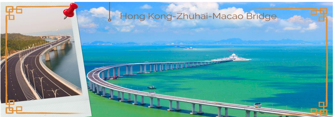
CHXH9 ฮองกง-มาเก๊าเดย์ทัวร์ เที่ยวจุใจ 4วัน2คืน สายการบิน Hongkong Airlines (Jun-Oct' 26)

วันสอง กรุงเทพฯ สุวรรณภูมิ- ฮองกง (สนามบินเซ็กเล้งก๊อก) – เที่ยวมาเก๊าแบบวันเดย์ทัวร์ ไปเช้า-กลับเย็น 02.40 น. นำท่านเดินทางสู่ ฮองกง โดยสายการบิน HONG KONG AIRLINES (HX) เที่ยวบินที่ HX768 07.00 น. เดินทางถึงสนามบินเซ็กเล้งก๊อก เขตปกครองพิเศษฮองกง นำทุกท่านเข้าพิธีการตรวจคนเข้าเมืองหลังจากผ่านพิธีการตรวจคนเข้าเมืองเป็นที่เรียบร้อยแล้ว รับกระเป๋าสัมภาระ และเดินทางโดยรถโค้ชปรับอากาศ **โปรดทราบ เวลาท้องถิ่นที่ฮองกงเร็วกว่าประเทศไทย 1 ชั่วโมง กรุณาปรับนาฬิกาให้ตรงกับเวลาท้องถิ่น เพื่อความสะดวกในการนัดเวลานะคะ** อีสาระให้ท่านแวะทำธุระส่วนตัวตามอัธยาศัย หลังจากทำธุระส่วนตัวเป็นที่เรียบร้อยแล้ว นำกระเป๋าสัมภาระส่วนตัว และเดินทางโดยรถโค้ชปรับอากาศ (สัมภาระฝากไว้ที่รถ) นำท่านเดินทางสู่ มาเก๊า (MACAU) หรือ เอ้าเหมิน (รถโค้ชปรับอากาศ) ด้วยการเดินทางผ่านเส้นทางสะพาน Hong kong – Zhuhai – Macao Bridge สะพานมีความยาว 55 กิโลเมตร ซึ่งเป็นสะพานข้ามทะเลที่ยาวที่สุดในโลก สะพานดังกล่าวเปิดใช้งาน เมื่อวันที่ 23 ต.ค. 2561 ซึ่งเชื่อมระหว่างเขตบริหารพิเศษฮองกง กับเมืองจูไห่ของมณฑลกวางตุ้ง และเขตบริหารพิเศษมาเก๊าของจีน โดยสะพานเส้นทางนี้นับเป็นครั้งแรก ที่จะช่วยลดระยะเวลาการเดินทางจากฮองกงไปยังจูไห่และมาเก๊า จากเดิม 3 ชั่วโมง ให้เหลือเพียงภายใน 1 ชั่วโมง มาเก๊า มีชื่อทางการว่า เขตบริหารพิเศษมาเก๊าแห่งสาธารณรัฐประชาชนจีน เป็นพื้นที่บนชายฝั่งทางใต้ของประเทศจีน เป็นเขตปกครองพิเศษของจีน โดยมีฐานะเป็น เขตบริหารพิเศษภายใต้หลักการ หนึ่งประเทศสองระบบ ผู้ที่อาศัยอยู่ในมาเก๊าส่วนใหญ่พูดภาษากวางตุ้งเป็นภาษาแม่ ภาษาจีนกลาง ภาษาโปรตุเกส และภาษาอังกฤษ ชาวมาเก๊า มี