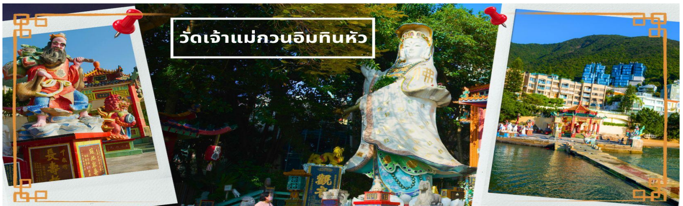
CHXH9 ฮ่องกง-มาเก๊าเดย์ทัวร์ เที่ยวจุใจ 4วัน2คืน สายการบิน Hongkong Airlines (Jun-Oct' 26)

เช้า 📌 บริการอาหารเช้า ณ ภัตตาคาร **เมนูติ่มซำต้นตำหรับฮ่องกง** (3) จากนั้นนำท่านเดินทางสู่ วัดเจ้าแม่กวนอิมหินหัว อ่าวรีพลัสเบย์ (TIN HAU TEMPLE REPULSE BAY) ตั้งอยู่ริมทะเล เป็นสถานที่ท่องเที่ยวสำคัญ สร้างขึ้นในปี ค.ศ.1993 วัดแห่งนี้ถูกสร้างขึ้นเพื่อคุ้มครองชาวประมงในการออกเรือไปหาปลา ซึ่งเป็นหนึ่งในวัดที่เก่าแก่ที่สุดของฮ่องกง บริเวณวัดจะมี เจ้าแม่กวนอิมองค์ใหญ่ ประดิษฐานพระตั้งอยู่เป็นเทพที่ชาวฮ่องกงและคนจีนให้ความเคารพนับถือมากที่สุด สามารถขอพรได้ทุกเรื่อง วัดนี้เป็นที่นิยมมีนักท่องเที่ยวเดินทางมาขอพรกันมากมาย เพราะเชื่อในความศักดิ์สิทธิ์ และยังมีเจ้าแม่ทับทิม หรือเทพิตาแห่งท้องทะเลองค์ใหญ่ ซึ่งคนฮ่องกง คนมาเก๊า และคนจีน ที่อยู่ริมทะเล ชาวประมง นักเดินเรือหรือผู้ที่เดินทางทางเรือเป็นประจำ จะนับถือ