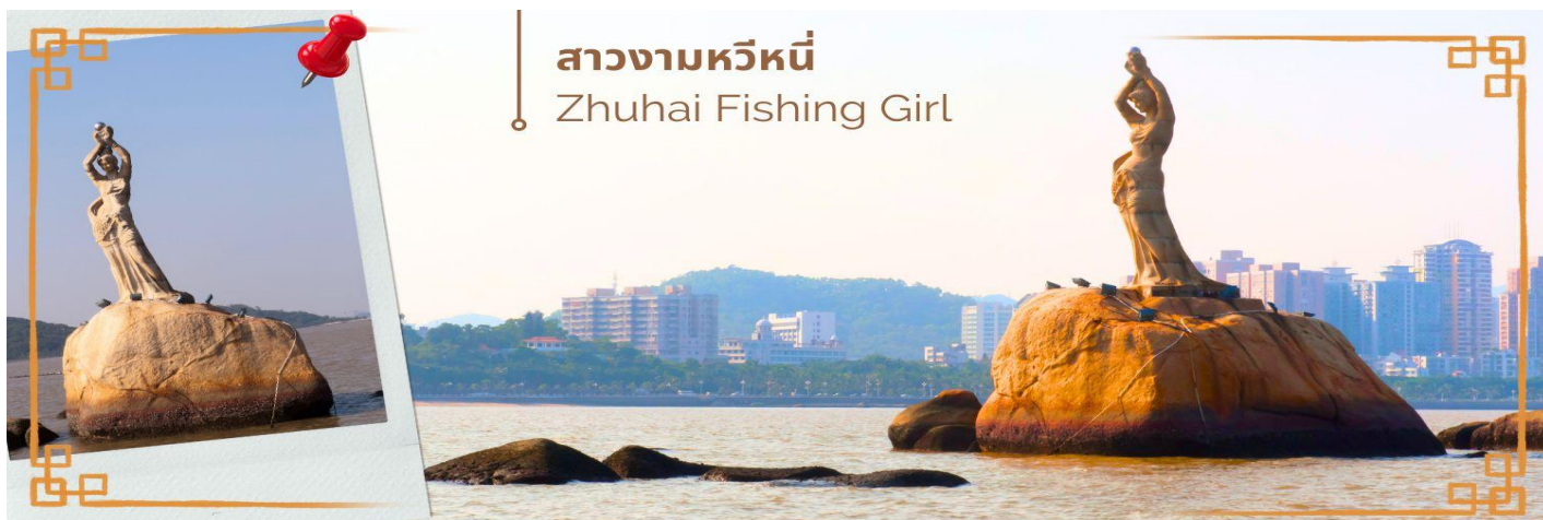
สาวงามหวีหนี่ Zhuhai Fishing Girl

จากนั้นนำท่านแวะซื้อ ยาแก่น้ำร้อนลวก ร้านยา เป่าฟู่หลิง บัวหิมะ ยาประจำบ้านที่มีชื่อเสียง ท่านจะได้ชมการสาธิตการนวดเท้า ซึ่งเป็นอีกวิธีหนึ่งในการผ่อนคลายความเครียด และบำรุงการไหลเวียนของโลหิตด้วยวิถีธรรมชาติ และนำท่าน